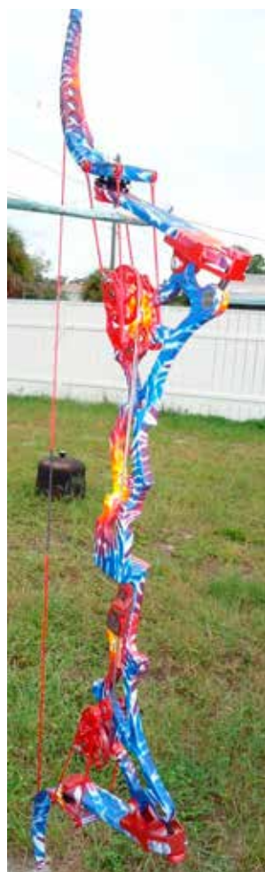
LEVERBOW FRA 5150 BOWS. MODEL: CONSPIRACY.

Ok – nu har jeg vist fået forklaret hvordan buen ser ud og hvordan den virker – men hvorfor er den så fantastisk? Min bue er en Phoenix fra Monster Bows og for mig er det, det perfekte mix mellem recurvebue og compoundbue der tiltaler mig. Buens udseende og det geniale design er det, der især har