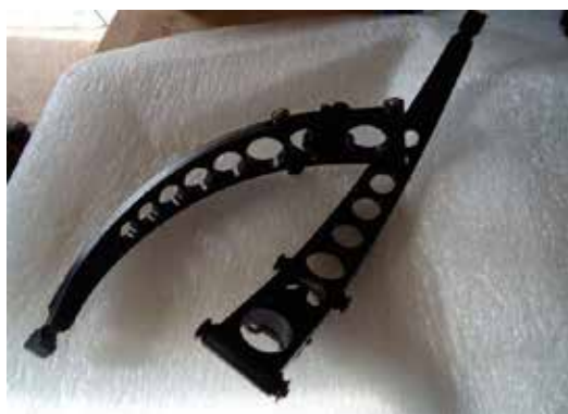
OUTBOARDS AF ALUMINIUM, FRA 5150 BOWS.

Leverbow er en buetype, der er stort set "uopdaget land" i Europa og især i Danmark, på den måde at ikke mange bueskytter kender buetypen – endelige skyder med den. Selv blandt de danske dommere, er buetypen ikke udbredt kendt – har jeg fundet ud af ved min deltagelse i mange 3D-stævner rundt i landet i løbet af 2011. Nogle få bueskytter kender lidt til buetypen fra internettet og kender den da som en "Oneida" – men leverbow er meget mere end Oneida. Det ringe kendskab til buen er faktisk synd, fordi det er en helt fantastisk buetype, som er utroligt dejlig at skyde med.