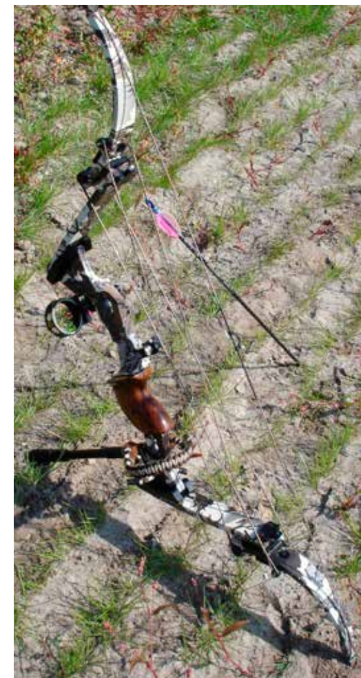
PHOENIX FRA MONSTER BOWS. CAMLESS LEVERBOW.