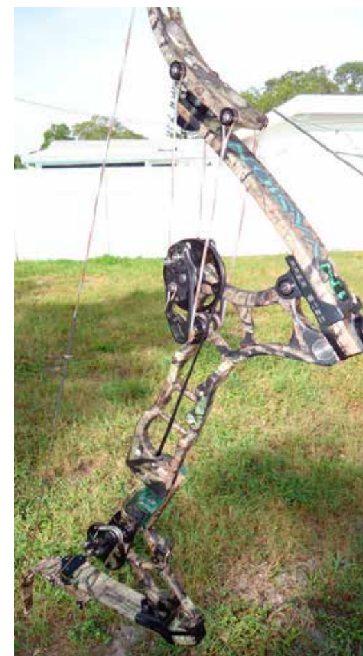
LEVERBOW FRA 5150 BOWS. MODEL: INVASION.

Buetyper har ry for at være støjende og måske også af forholdsvis dårlig kvalitet. Dette passer måske med buerne fra Oneida Eagle, men det passer ikke med buerne fra Monster Bows, 5150 Bows samt Oneida Eagle buer, der er kundetilpasset og ombygget i Gulfcoast Archery ved Richard Vance.