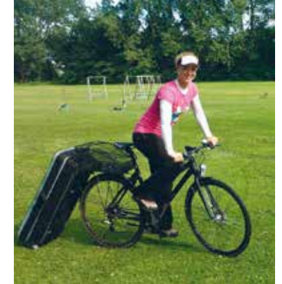
I 2012 BRUGES CYKLEN OGSÅ TIL TRANSPORT AF BUESKYTTEN OG DENNES UDSYR. OL-SKYTTEN LOUISE LAURSEN SPENDER OFTE SIN BUETASKE EFTER CYKLEN. TASKEN ER UDSYRET MED SMÅ HJUL, OG DET GØR DET NEMT AT KOMME TIL OG FRA TRÆNING.