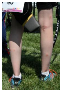
Masser af myg der giver store myggestik