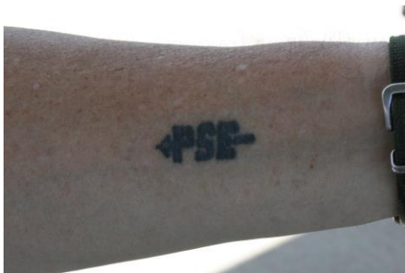
Tattoo af buelogo, så er man fan.

Her er lidt stemningsbilleder fra området: