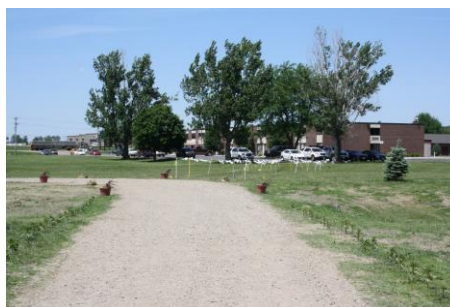
Hotellet set fra skydebanen